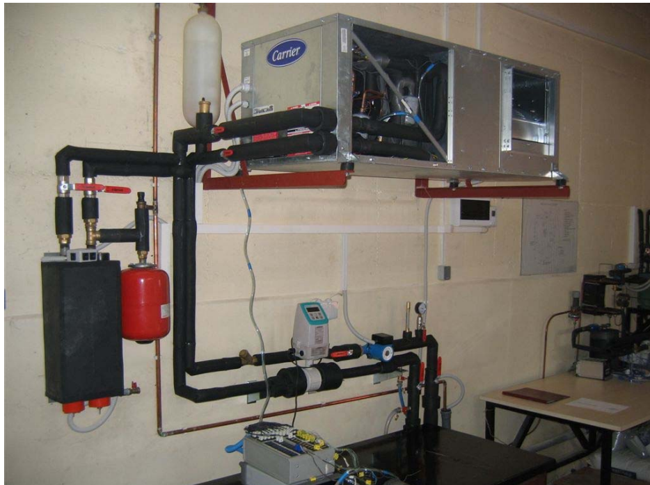
Slika 8. Dizalica topline voda-zrak s mjernom opremom

Dizalica topline voda-zrak postavljena je unutar laboratorija i spojena na izmjenjivač topline u bušotini. Koristeći tlo kao toplinski spremnik dizalica topline ima mogućnost rada u režimu hlađenja i režimu grijanja ( Slika 8 ), a opremljena je s temperaturnim osjetnicima, te protokomjerom na strani vode. Svi osjetnici su preko akvizicijskog uređaja vezani na računalo, čime je omogućeno praćenje i spremanje podataka.