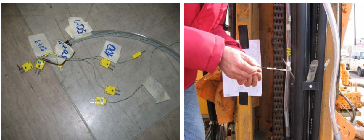
Slika 5. a) Priprema temperaturne sonde s termoparovima; b) Pozicioniranje termopara prilikom polaganja sonde

Temperaturna sonda s petnaest osjetnika, koja je u bušotinu ugrađena zajedno s toplinskom sondom, prethodno je složena u laboratoriju, pri čemu su žice termoparova tipa K zaštićene ulaganjem u zaštitno crijevo (Slika 5).