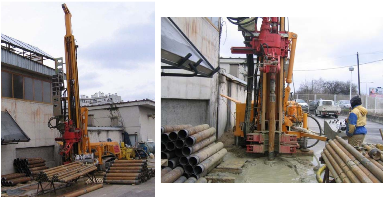
Slika 1. a) Bušilica, pumpa i ostali pribor za bušenje; b) Bušenje u zaštitnoj koloni

U suradnji s tvrtkom FIL.B.IS. Hidro-Geo koja sudjeluje u realizaciji znanstvenog projekta koji se provodi uz potporu Ministarstva znanosti, obrazovanja i športa pod nazivom Korištenje tla kao obnovljivog toplinskog spremnika , u neposrednoj blizini laboratorija izvedena je bušotina promjera 152 mm, dubine 100 m. Bušenje je provedeno primjenom zaštitnih kolona ( Slika 1 ). Zaštitne kolone, izvedene u obliku čeličnih cijevi vanjskog promjera 152 mm i dužine 1,5 m, tijekom bušenja se ugrađuju u bušotinu. Ispiranje sastojaka zemlje provodi se pomoću mješavine vode i bentonitne gline, koja se do bazena na površini protiskuje s vanjske strane kolone.