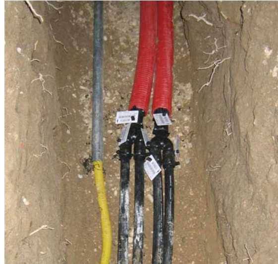
Slika 7. a) Elektrofuzijsko zavarivanje toplinske sonde s polaznom i povratnom cijevi; b) Uvođenje temperaturne i toplinske sonde u zgradu laboratorija

Dizalica topline voda-zrak postavljena je unutar laboratorija i spojena na izmjenjivač topline u bušotini. Koristeći tlo kao toplinski spremnik dizalica topline ima mogućnost rada u režimu hlađenja i režimu grijanja ( Slika 8 ), a opremljena je s temperaturnim osjetnicima, te protokomjerom na strani vode. Svi osjetnici su preko akvizicijskog uređaja vezani na računalo, čime je omogućeno praćenje i spremanje podataka.