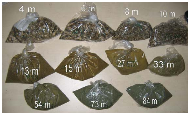
Slika 2. Uzorci tla po visini bušotine

Slika 2 prikazuje dio uzoraka tla koji su uzimani na raznim dubinama bušotine. U početnih desetak metara tlo je sitno šljunčano, zatim postaje pjeskovito, da bi nakon petnaestak metara tlo bivalo zaglinjeno, i tako sve do 100 metara dubine.