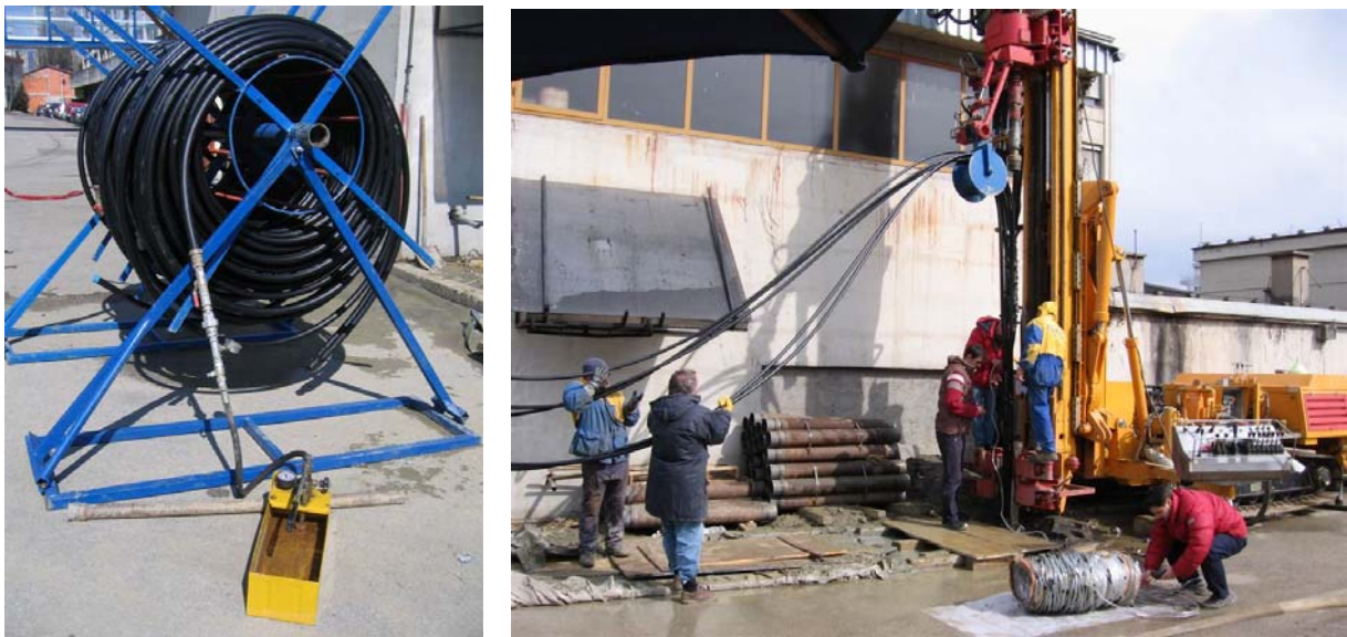
Slika 4. a) Tlačna proba; b) Polaganje izmjenjivača i temperaturnih osjetnika

Distancne obujmice su postavljane na razmacima od 2,5 m, radi što boljeg centriranja sonde u bušotini i održavanja razmaka između PE cijevi. Lakšoj ugradnji sonde i njezinom boljem centriranju pomaže i uteg mase 30 kg, koji je prije ulaganja u bušotinu obješen na donjem kraju sonde.