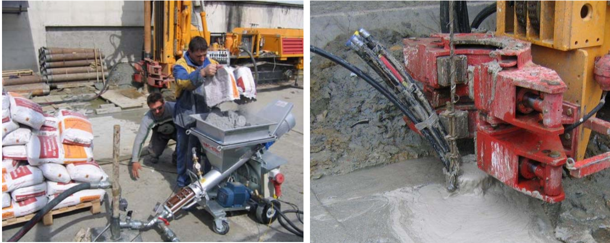
Slika 6. a) Pumpa za cementiranje; b) Završetak cementiranja

Cementiranje bušotine provedeno je korištenjem specijalne pumpe s mješalicom za tu namjenu koja omogućuje računalno kontroliranu pripremu smjese ( Slika 6 ). Gustoća smjese za cementiranje je 1460 \text{ kg/m}^3 , a dobiva se tako da se na 810 kg punila dozira 610 litara vode.